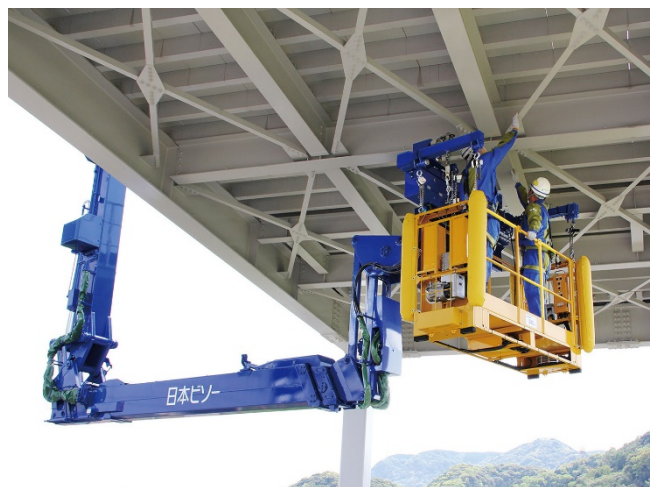
▲ 安全に点検・補修箇所へアクセス可能