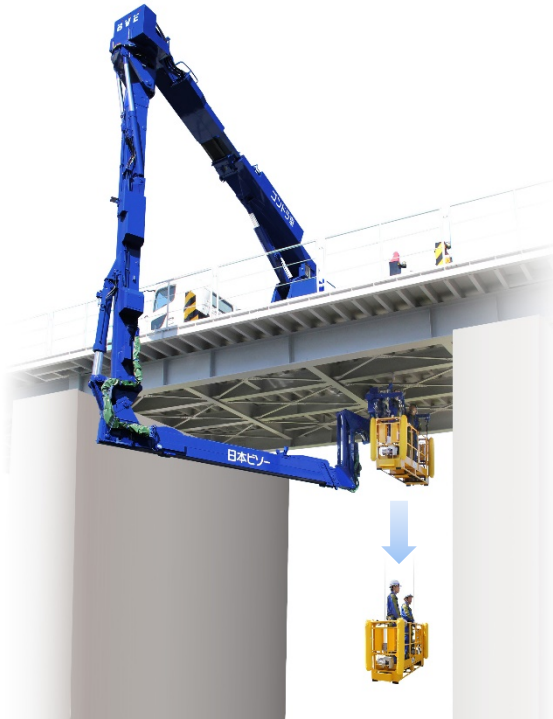
▲ 橋梁下部64.5mまでアクセス可能なゴンドラ車