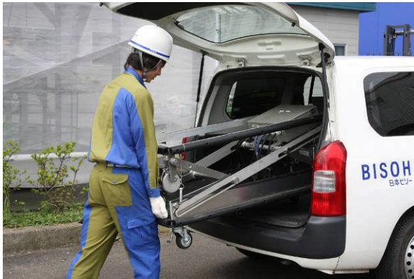
▲ バンタイプの乗用車でも運搬可能