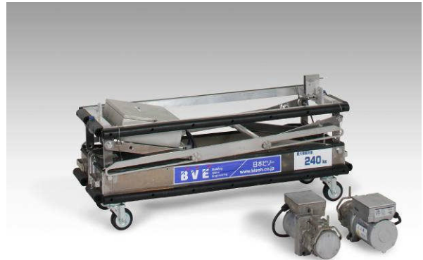
▲ 昇降機は簡単に脱着可能。昇降機を外した場合重量約41kg 高さ 580mm までコンパクトに。